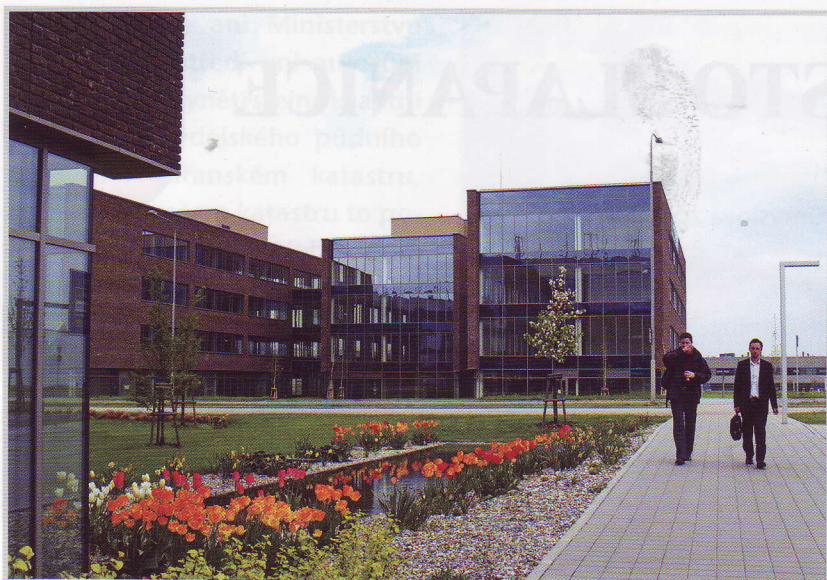
CTPark Ostrava – administrativní budova

více způsoby: přímo průmyslovou zónou budou projíždět autobusové linky a dojde k posílení příměstské železniční dopravy až do našeho železničního nádraží, se zastávkou v prostoru u Jungmannovy ulice. Co se týče životního prostředí, více než třetina ploch bude ozeleněných (stromy, křoviny, trávníky), je smluvně podchyceno tzv. decentralizované hospodaření s dešťovou vodou , která tak kombinací vsaků, odpařování a ošetřování zeleně zůstane co nejvíce v území, bude ho ochlazovat a udržovat podzemní vody v rozsahu blízkém dnešním stavu. Investor také již realizuje na střeších postavených objektů fotovoltaické články pro výrobu elektřiny ze sluneční energie.