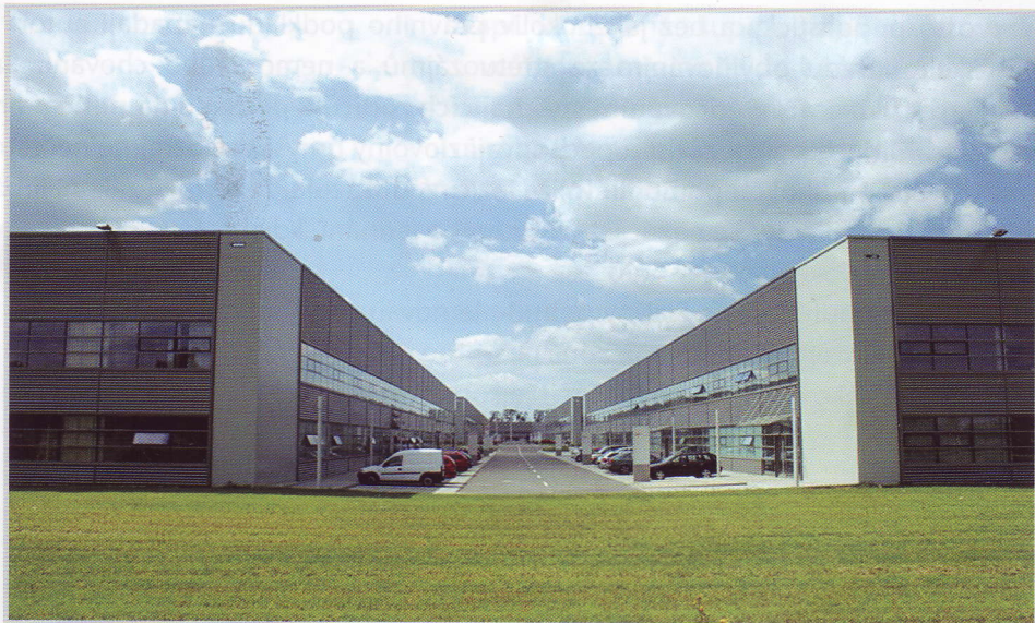
CTPark Ostrava – objekty Flexi space

Oblast šlapanicka je poměrně chudá na srážky. To víme všichni, ví to investor i zástupci města. Proto projekční záměry počítají s možnostmi pro zachování maximálního množství dešťové vody v území. Této oblasti je věnována více než standardní pozornost vyjádřená dohodou o jejím decentralizovaném hospodaření.