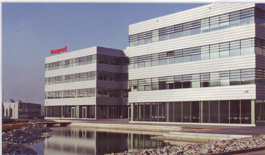
CTPark Brno (Černovická terasa) – administrativní budova Honeywell

Všechny orgány města – nynější i minulé – měly na zřeteli především zájem města a jeho občanů, když zvažovaly všechno pro a proti: buď volnou krajinu s velkovýrobním zemědělským hospodařením, nebo návrh na urbanizované, zastavěné území s různě velkými halovými objekty jednoduchého, ale účelného designu, s promyšlenou vnitro-areálovou vzrostlou i nízkou zelení (na obdobné zóny se můžete kdykoliv podívat např. v sousední Slatině nebo v Modřicích. Mnozí tam možná i pracujete). Realizace průmyslové zóny jako celku byla od počátku myšlena jako postupná. Nyní, v důsledku ekonomické krize, bude dlouhodobá (rozložená do mnoha let) a přinese pracovní místa, která budou zcela jistě využívána také našimi občany.