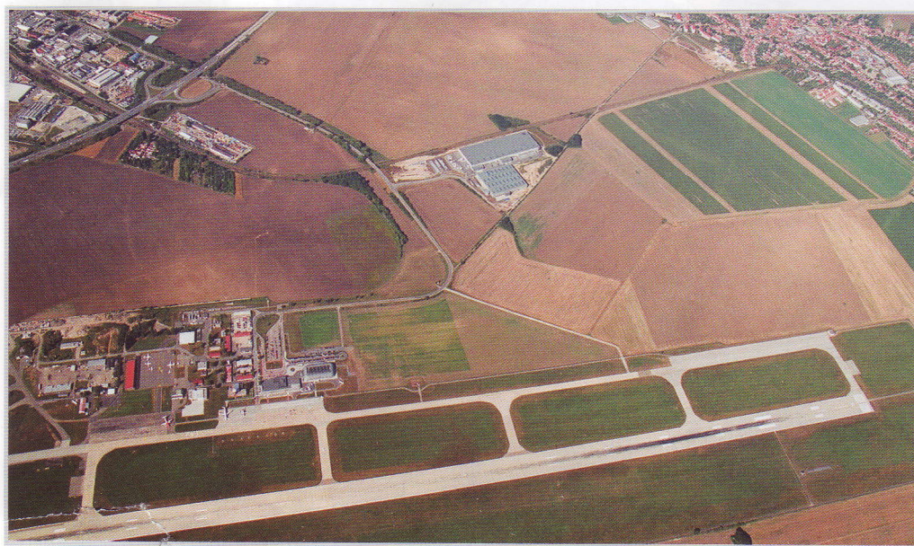
Letecký pohled – lokalita Letiště Brno-Tuřany, Šlapanice

A co říci závěrem? Komentovali jsme jen část falešných poplachů z nejnovějšího letáku, k němuž se hlásí občanské sdružení Čisté Šlapanice. Nehodláme s nikým vést pavlačovou diskusi. Ve Šlapanicích nelze žít současně jako ve vysoko-horském národním parku – v zeleni a na čerstvém vzduchu, mít přitom 10 minut chůze do práce o kterou nikdy nepřijdu, nadstandardní plat, supermarket ve vedlejší ulici, bezproblémový přístup do velkého města s jeho další obrovskou vybaveností ve zdravotnictví, školství, obchodu a neomezeném kulturním a sportovním vyžití. Nic není jen tak samo sebou a nezodpovědné by bylo zůstat stát na půli cesty.